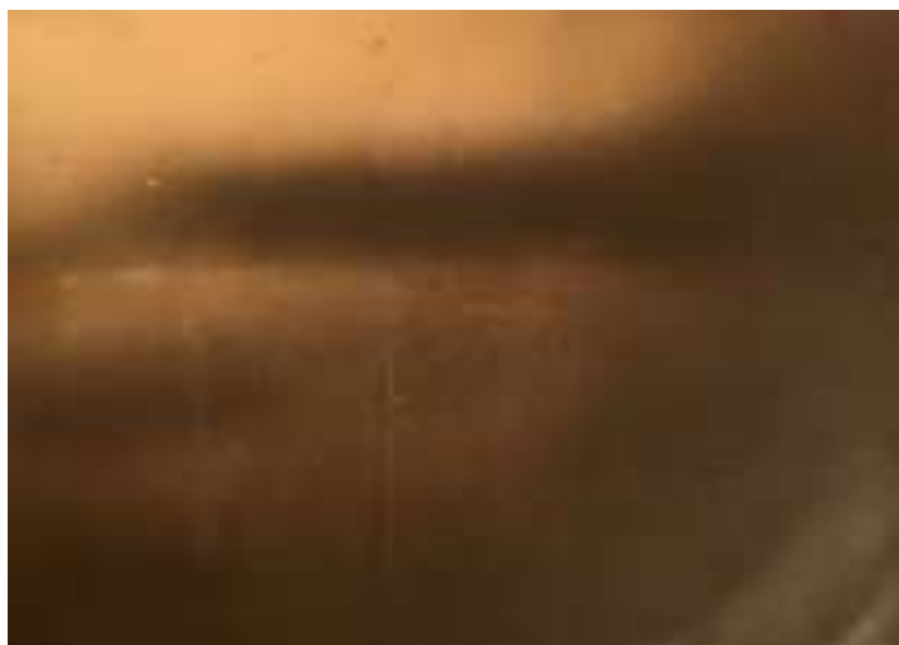
1942 год. Фото из кабины бомбардировщика.

Точки, которые видны в облаках – это атакующие истребители.