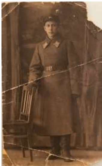
1937 год. Учеба в Оренбургской летной школе.