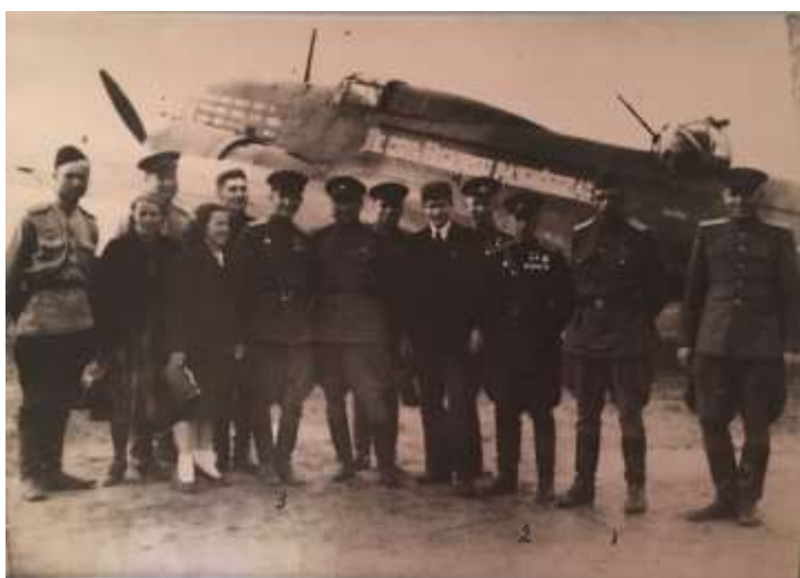
Экипаж со своим самолетом.