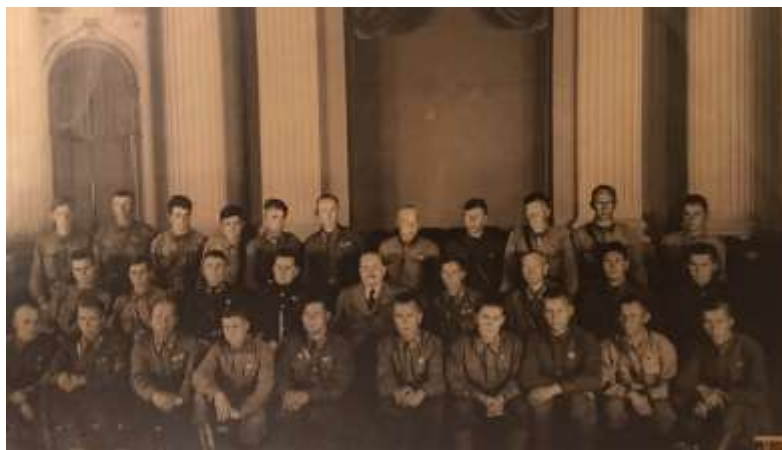
1942 год. Вручение первой «Золотой звезды». Кремль