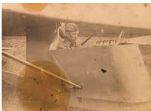
1940 год. Тренировочный полет.