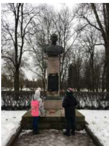
Правнуки с прадедом