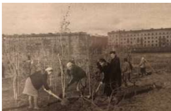
Московский Парк Победы. 1945 год.

Точки, которые видны в облаках – это атакующие истребители.