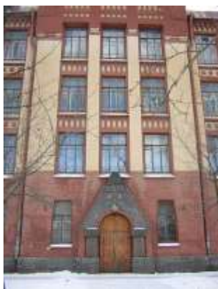
Школа № 25 (сейчас № 337)